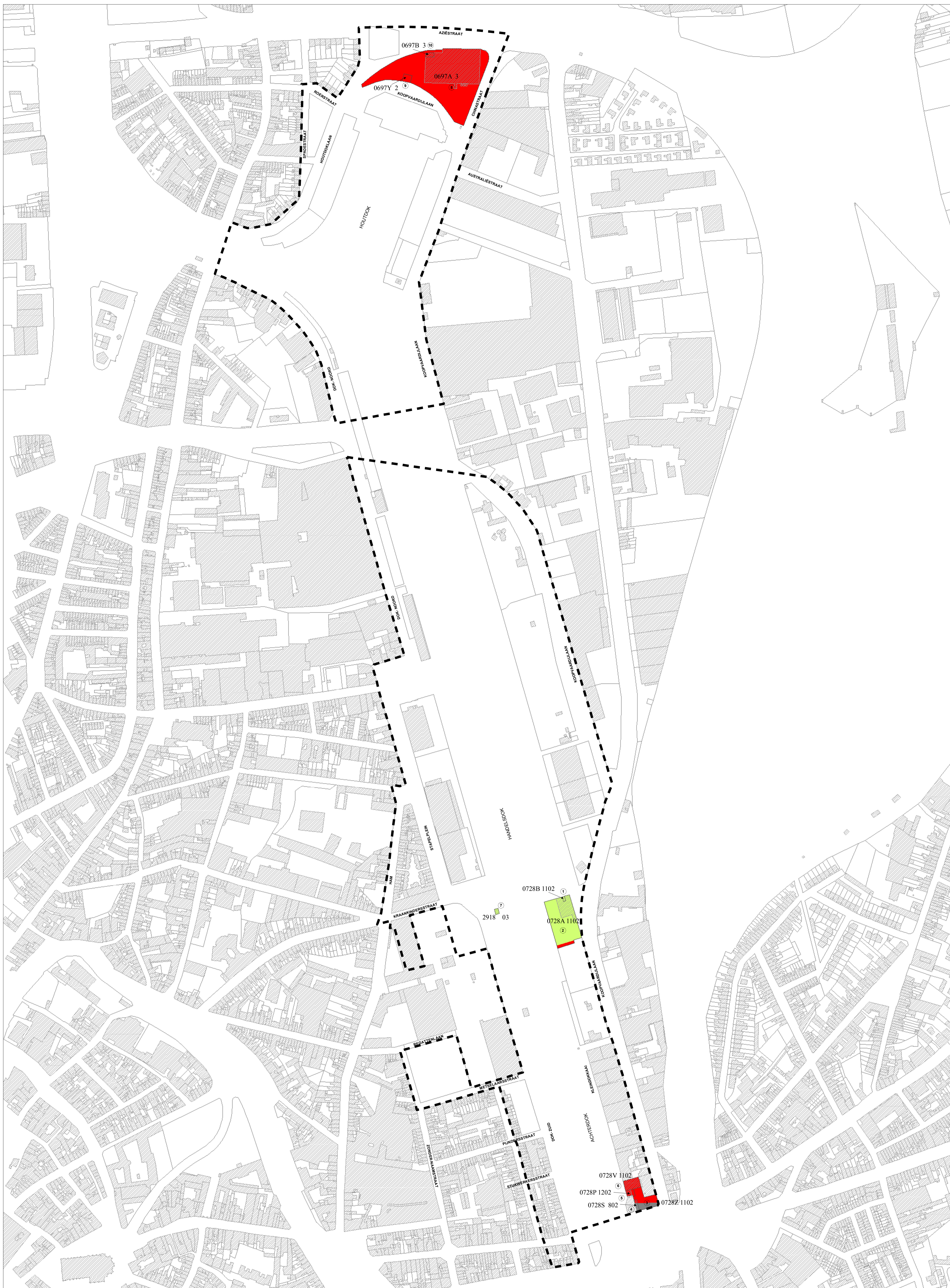
ONTEIGENINGSTABEL (opgemaakt op basis kadastrale gegevens 1/1/2009)